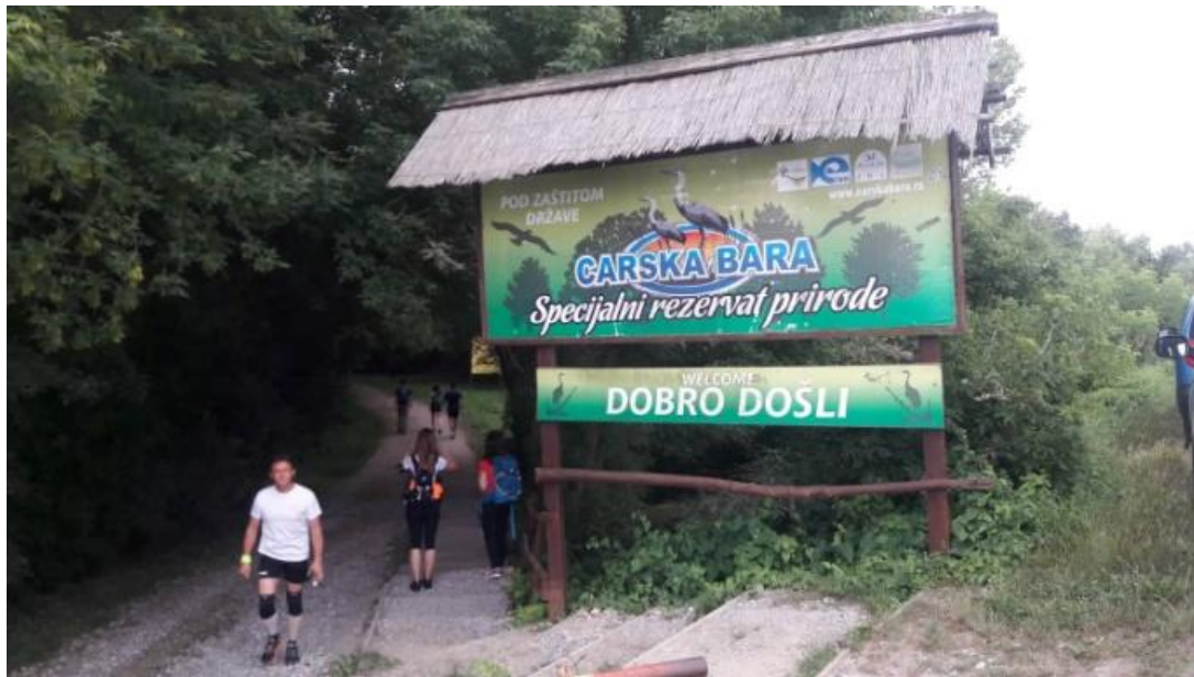
FOTO IZVEŠTAJ SA CARSKE BARE 10.6.2018.

Dobro došli u Carsku baru specijalni rezervat prirode.